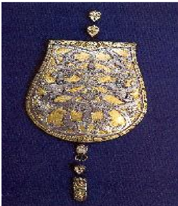
eszköz/tárgy neve: tarsolylemez előkerülésének helye: Karos