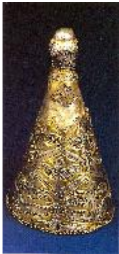
hajfonatkorong előkerülésének helye: Beregszász