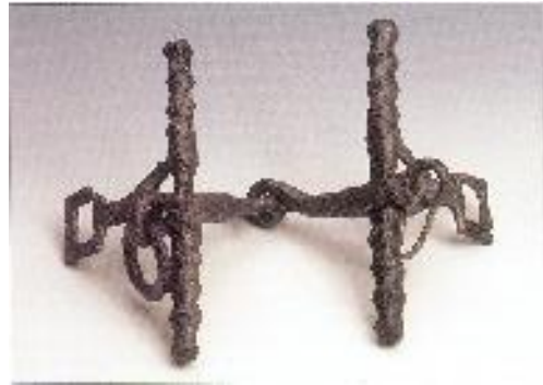
tárgy/eszköz neve: zabla előkerülésének helye: Neszmély