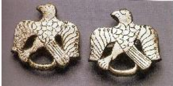
eszköz/tárgy neve: övdísz előkerülésének helye: Karos

Ismerd fel a következő eszközöket, tárgyakat! Határozd meg a leletek előkerülésének helyszínét! (eszköz felismerése: 1 pont , helyszín meghatározása: 2 pont)