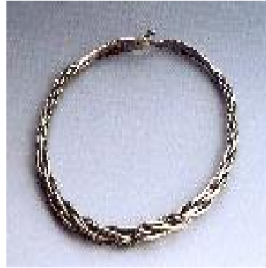
eszköz/tárgy neve: nyakperec előkerülésének helye: Galgóc