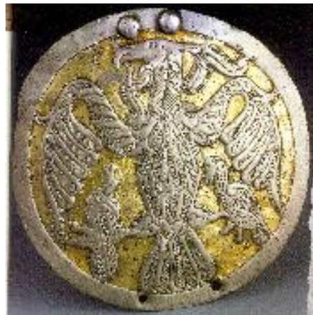
tárgy/eszköz neve: előkerülésének helye: Rakamaz