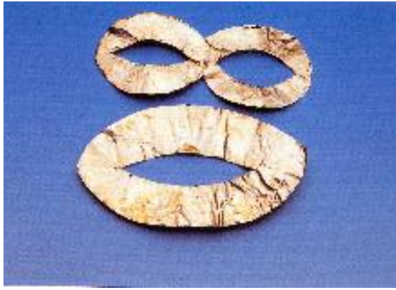
tárgy/eszköz neve: szem és szájlemez előkerülésének helye: Rakamaz